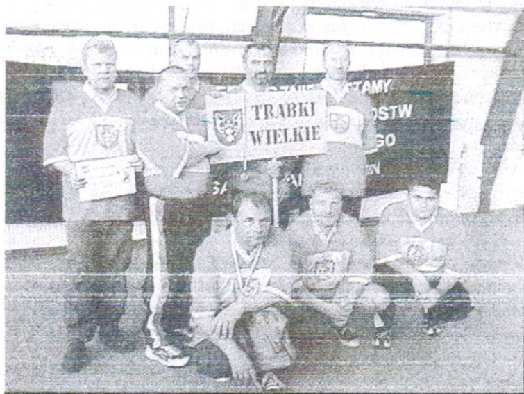
Reprezentanci naszej gminy