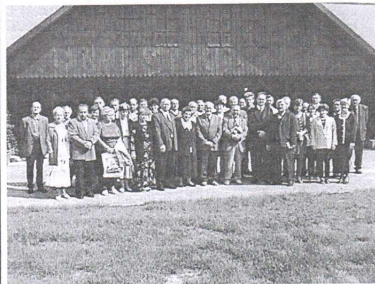
Przewodniczący Rady Gminy