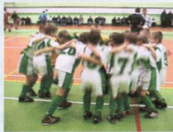
Tak się cieszą najmłodsi piłkarze ze zwycięstwa

Jeszcze trwają dyskusje kibiców z Powiatowej Ligi Piłki Nożnej, a już rozpoczęły się rozgrywki Gminnej Ligi Halowej Piłki Nożnej „TRĄBKI WIELKIE 2001” organizowanej przez GOKSiR w Trąbkach Wielkich Zapraszamy kibiców sympatyków piłki nożnej na niedzielne spotkania tej ligi, która potrwa do 18 marca b.r. Spotkania 16-stu rywalizujących ze sobą drużyn seniorskich z terenu naszej gminy i gmin ościennych, odbywają się na hali sportowej w każdą niedzielę w godzinach od 13.00 do 18.30. W najbliższym terminie tj. 18.02.2001 spotkają się: