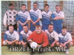
ORZEŁ I Trąbki Wlk