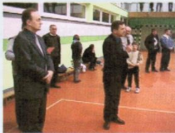
Starosta Powiatu i Wójt Gminy Trąbki Wielkie podczas wręczenia nagród