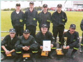
Zwycięska drużyna OSP Trąbki Wielkie