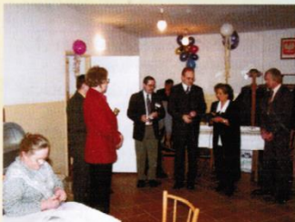
Otwarcie świetlicy w Kleszczewie