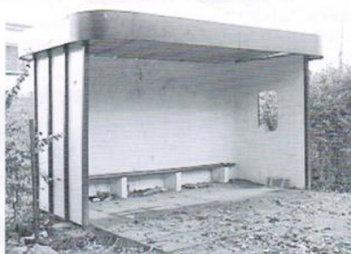
Budowa wiat przystankowych w Golebiewku, Kleszczewie, Cząstkowie, Domachowie, Trąbki Małe, Rościszewko, Kaczki - 30 tys.zł