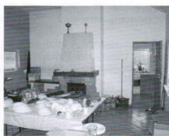
Świeltica w Trąbkach Małych - 147 tys.zł