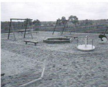
Plac zabaw Domachowo 31 tys.zł