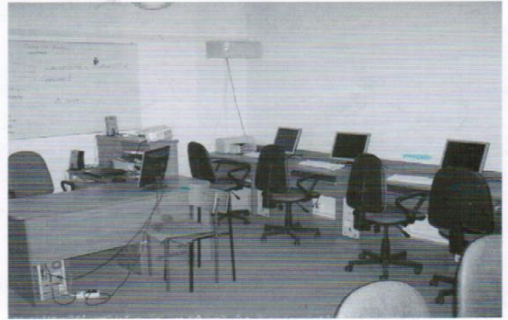
Szkoła Podstawowa w Kłodawie: wymiana całej stolarki okiennej i drzwiowej, położono nowe wejście do szkoły, przebudowano schody, szkoła otrzymała nową profesjonalną pracownię internetową.