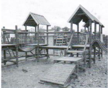
Plac zabaw Pawłowo 27 tys.zł