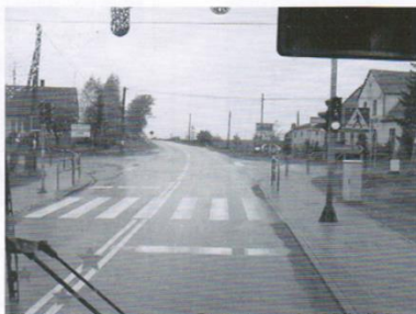
Skrzyżowanie w Gołębiewie Wielkim udział gminy 50 tys.zł.