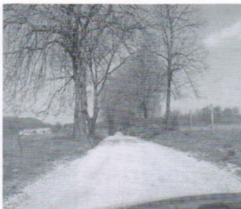
Droga Czermiec - Zaskoczyn 30 tys.zł.