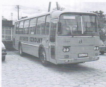
Zakup autobusu szkolnego - 364 tys. zł.