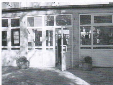
Szkoła Podstawowa w Sobowidzu: kompleksowy remont (pierwszy od prawie 30 lat) sali gimnastycznej, wejścia głównego do szkoły, wymiana stolarki okiennej i drzwiowej.