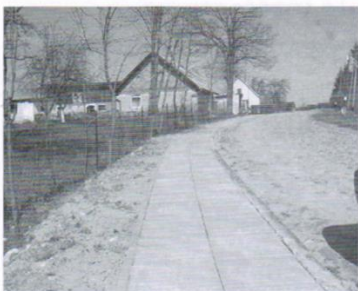
Chodnik Warcz-2,9 tys.zł.