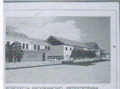
KONCEPCJA PROGRAMOWO - PRZESTRZENNA