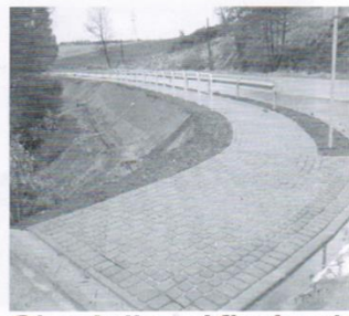
Chodnik w Kłodawie 165 tys.zł