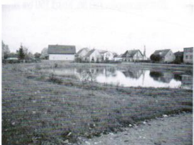
Zagospodarowanie centrum wsi Mierzszyn - 45,5 tys.zł