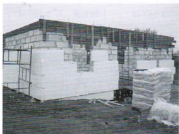
Budowa świelticy w Golebiewie Średnim -165 tys.zł