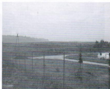
Zakup gruntu pod inwestycje w Trąbkach Wielkich - 282 tys. zł.