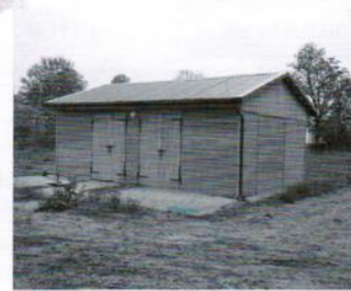
Włata festynowa w Cząstkowie - 28 tys.zł.