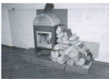
Świeltica Kleszczewo 49 tys.zł