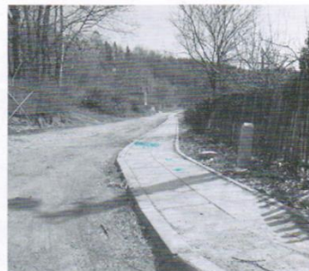
Chodnik Drzewina 6,9 tys.zł.