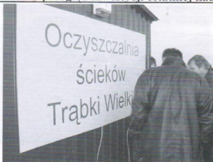
Budowa oczyszczalni ścieków w Trąbkach Wielkich - 1,2 mln. zł.