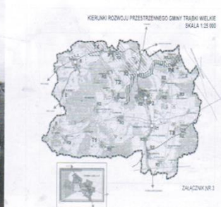
Plan zagospodarowania przestrzennego dla 20 miejscowości 790 ha. Koszt 150 tys zł.