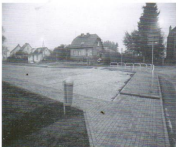
Parking i chodnik w Sobowidzu 339 tys.zł