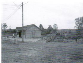
Włata festynowa w Złej Wsi 31 tys.zł