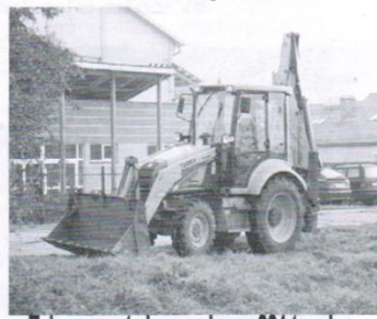
Zakup sprzętu komunalnego 221 tys.zł.