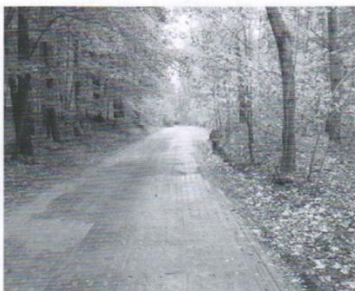
Droga Kaczki - Łaguszewo - 179 tys.zł