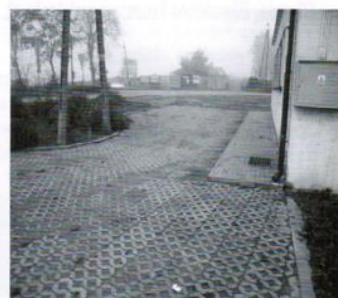
Zagospodarowanie terenu wokół parkingu w Golebiewku - 11 tys.zł