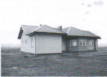
Świeltica w Elganowie - 260 tys.zł