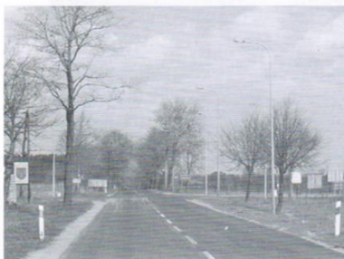
Oświetlenie dróg - 88 tys.zł.