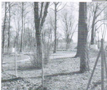
Wodociąg Kleszczewo, Gołębiewo Cegielnia, Błotnia, Elganowo koszt: ponad 1mln. zł.