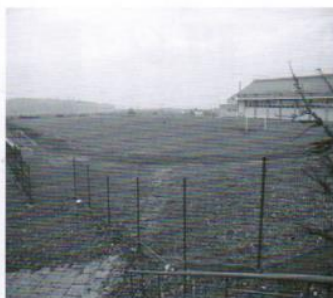
Boisko w Trąbkach Wielkich 100 tys.zł.