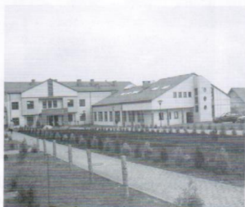
Budowa gimnazjum w Trąbkach Wielkich - 7,4 mln. zł.