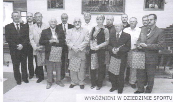
WYRÓŻNIENI W DZIEDZINIE SPORTU