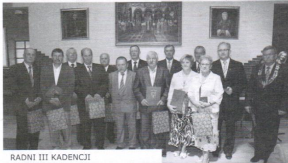
RADNI III KADENCJI