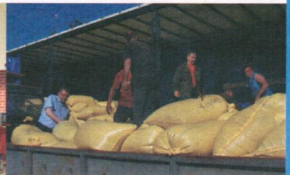
Pomoc rolników z Gminy Trąbki Wielkie, rolnikom z gminy Wilków w woj. Lubelskim poszkodowanym przez tegoroczną powódź