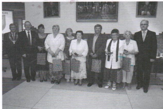
WYRÓŻNIENI PRACOWNICY - EMERYCI URZĘDU GMINY