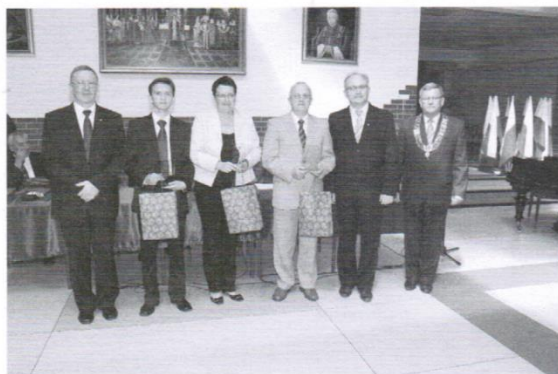
GOŚCIE, KTÓRZY OTRZYMALI PAMIĄTKOWE STATUETKI