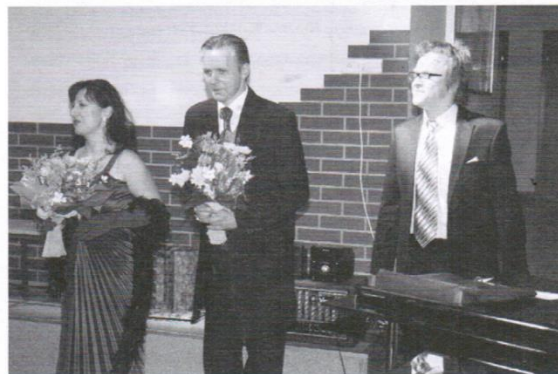
ARTYŚCI PODCZAS WYSTĘPU