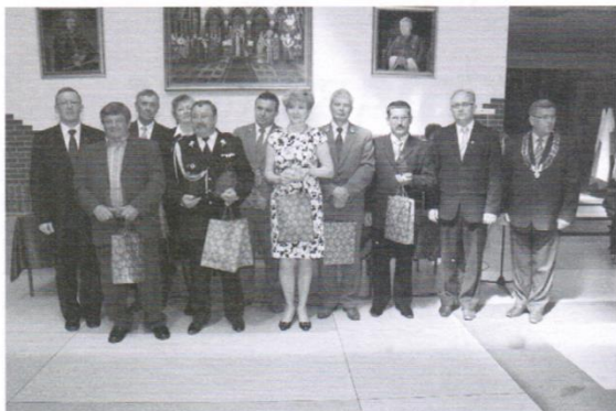
WYRÓŻNIENI W DZIEDZINIE BEZPIECZEŃSTWA