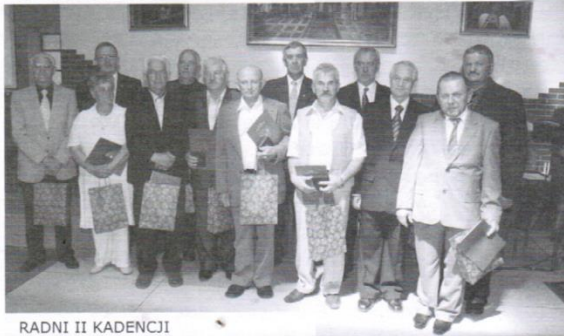
RADNI II KADENCJI