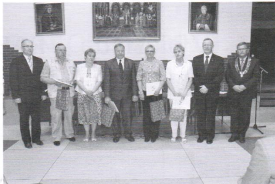
WYRÓŻNIENI PRACOWNICY URZĘDU GMINY TRĄBKIE WIELKIE