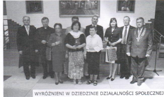
WYRÓŻNIENI W DZIEDZINIE DZIAŁALNOŚCI SPOŁECZNEJ