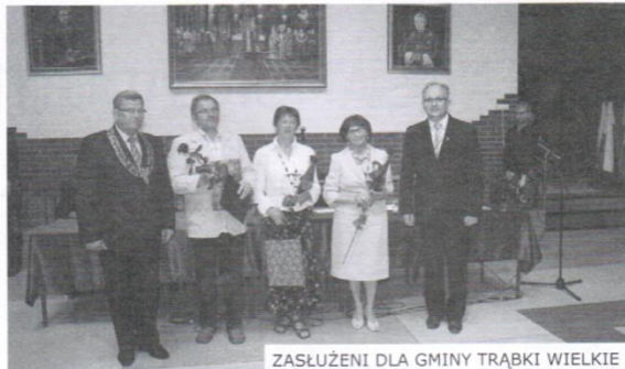
ZASŁUŻENI DLA GMINY TRĄBKÓW WIELKIE