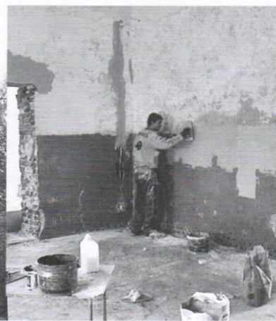
Jak widać świetlica wymagała dogłębnego remontu