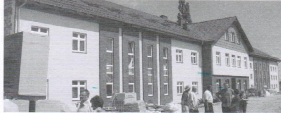
Rozbudowa Szkoły Podstawowej w Mierzeszynie, stan 30 czerwca 2010 r.