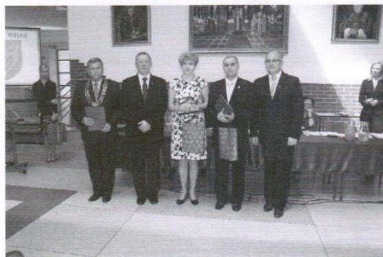
RADNI DO RADY POWIATU Z GMINY TRĄBKIE WIELKIE