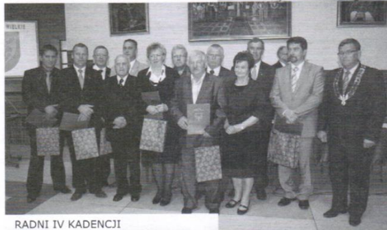
RADNI IV KADENCJI