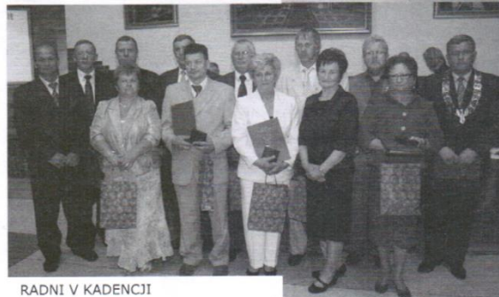
RADNI V KADENCJI