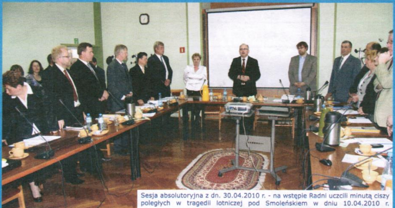
Sesja absolutoryjna z dn. 30.04.2010 r. - na wstępie Radni uczcili minutą ciszy poległych w tragedii lotniczej pod Smoleńskiem w dniu 10.04.2010 r.

Jak zawsze z wielkim poważaniem Zespół Redakcyjny