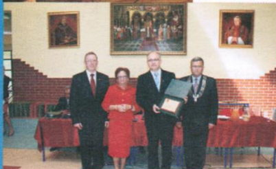
Radni wyróżnili także Wójta za jego pracę w Samorządzie Gminy Trąbki Wielkie