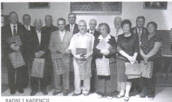
RADNI I KADENCJI