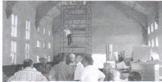
Tak przebiegały prace wewnątrz dobudowywanej sali gimnastycznej

z nowo powstałymi pomieszczeniami. Zakończenie prac planowane jest na koniec lipca 2010 r., trzymamy zatem kciuki za szybką i udaną realizację inwestycji oraz czekamy na uroczyste otwarcie!