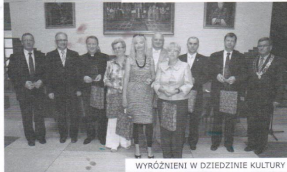
WYRÓŻNIENI W DZIEDZINIE KULTURY