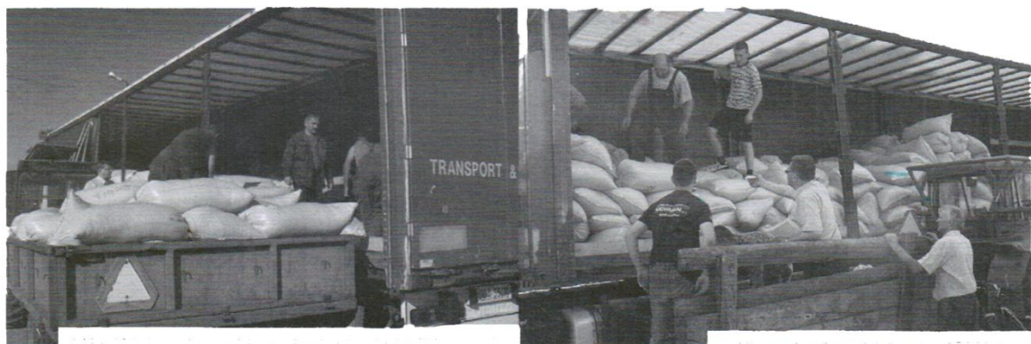
14.08.2010r. Zbiórka żywności w miejscowości...

W ramach akcji "Pomoc Powodzianom" mieszkańcy powiatu wzięli udział w zbieraniu i pakowaniu żywności. W tym celu zorganizowano zbiórki w szkołach i innych miejscach. Zbierana żywność jest pakowana w worki i transportowana do miejsc, gdzie potrzebują jej najbardziej. W ramach akcji "Pomoc Powodzianom" mieszkańcy powiatu wzięli udział w zbieraniu i pakowaniu żywności. W tym celu zorganizowano zbiórki w szkołach i innych miejscach. Zbierana żywność jest pakowana w worki i transportowana do miejsc, gdzie potrzebują jej najbardziej.