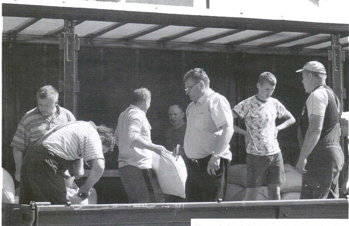
14.08.2010r. Zbiórka żywności w miejscowości...