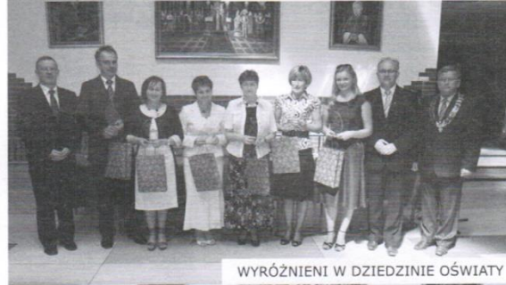
WYRÓŻNIENI W DZIEDZINIE OŚWIATY