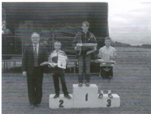
Najmłodszy triumfatorzy turnieju