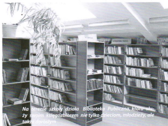
Na terenie szkoły działa Biblioteka Publiczna, która służy swoim księgozbiorem nie tylko dzieciom, młodzieży, ale także dorosłym

W nowym roku szkolnym dzieci uczyć się będą w 14