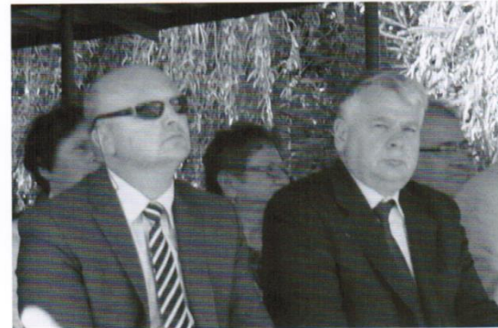
Na dożynki przybył także marszałek Senatu Bogdan Borusewicz