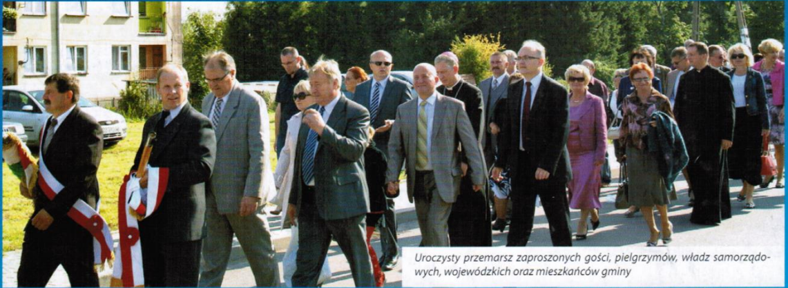
Uroczysty przemarsz zaproszonych gości, pielgrzymów, władz samorządowych, wojewódzkich oraz mieszkańców gminy