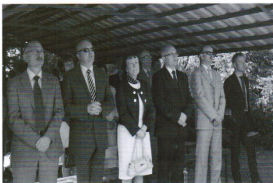
Władze samorządowe oraz politycy