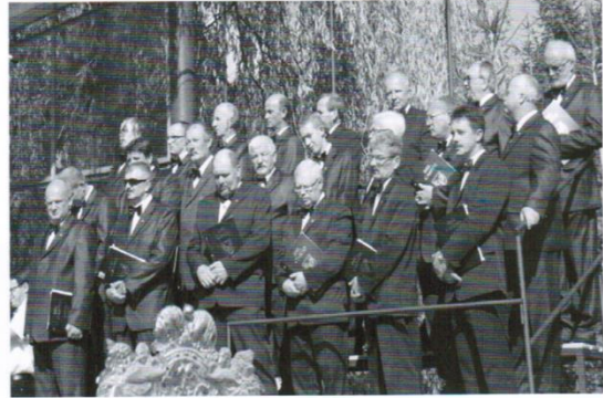
O oprawę muzyczną Mszy Św. zadbał chór Bel Canto