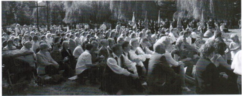
Tłumy zgromadzone na uroczystościach

Atrakcji nie zabrakło, organizatorzy przygotowali bowiem liczne konkursy np. „Wzorowa Gospodyni i Wzorowy Gospodarz”, podsumowanie gminnego konkursu „Piękna Wieś” oraz mnóstwo występów artystycznych. Na scenie pojawiają się: zespół ludowy „Gzuby Kociewskie”, kabaret „Świerszczychrząszcz”, zespół coverowy do tańca „Hot Line”. Gwiazdą wieczoru będzie zespół „Golden life”, a zwieńczeniem pięknych uroczystości – pokaz sztucznych ogni.