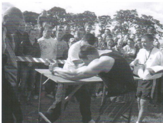
Najwięcej emocji wzbudziły konkurencje siłowe