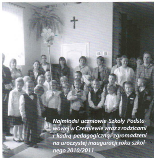
Najmłodszy uczniowie Szkoły Podstawowej w Czerniewie wraz z rodzicami i kadrami pedagogicznymi, zgromadzeni na uroczystej inauguracji roku szkolnego 2010/2011

1 wrzesień to dzień, w którym wspominamy smutne wydarzenie sprzed 71 lat – rocznicę wybuchu II wojny światowej. Krótkim akcentem historycznym uczniowie klasy VI przypomnieli całej społeczności szkolnej o wojennych wydarzeniach