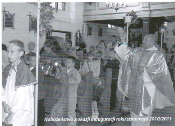
Nabożeństwo z okazji inauguracji roku szkolnego 2010/2011

Uroczyste rozpoczęcie roku szkolnego w Szkole Podstawowej w Trąbkach Wielkich zainaugurowała msza święta o godz. 8:00. Po mszy uczniowie i nauczyciele złożyli kwiaty pod tablicą upamiętniającą miejsce w którym mieściła się Ochronka i Szkoła Powszechna Macierzy Szkolnej w Wol-