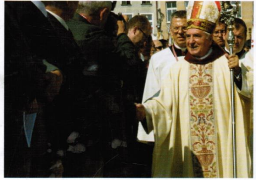
Prymas Polski abp. Józef Kowalczyk