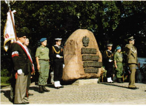
Obchody 66 rocznicy Powstania Warszawskiego w Gdańsku. Punktualnie o godzinie 17.00 na dźwięk syren wszyscy Gdańszczanie mogli oderwać się od codziennych obowiązków i choć przez chwilę oddać hołd poległym. Główne uroczystości miały miejsce u stóp pomnika Polskiego Państwa Podziemnego na Targu Rakowym.