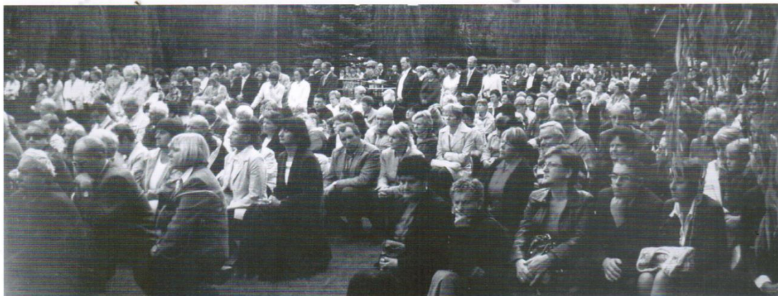
Tłumy zgromadzone na mszy świętej