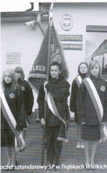
Orkiestra sztandarowa SP w Trąbkach Wielkich

ubiegłych, raz w miesiącu odwiedzać nas będą teatryki oraz „Pani Muzyka”, która przybliżyć dzieciom będzie tajniki różnych gatunków muzyki. Kadra przedszkola deklaruje z uśmiechem na ustach, że przez cały czas dokładać będzie starań, aby czas spędzony w przedszkolu zapisał się w pamięci najmłodszych, jako czas radości i zabawy tak, aby żal było opuszczać przedszkolne mury, a po wakacjach chętnie do nich wracać.