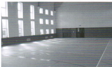
Szkolna sala sportowa w Mierzeszynie