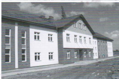
Rozbudowa Sz.P. w Mierzeszynie