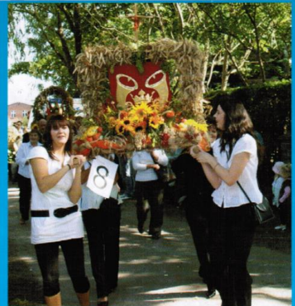
Przepiękne wieńce dożykowe zachwyciły przybyłych pielgrzymów

Hejnał Trąbkowski, ul. Sportowa 8, Trąbki Wielkie