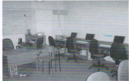
Szkoła Podstawowa w Kłodawie: wymiana całej stolarki okiennej i drzwiowej, położono nowe wejście do szkoły, przebudowano schody, szkoła otrzymała nową profesjonalną pracownię internetową.