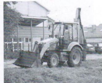
Zakup sprzętu komunalnego 221 tys.zł.