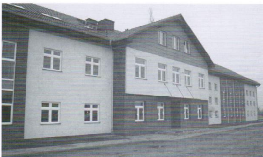
Szkola podstawowa wraz z salą gimnastyczną w Mierzeszynie