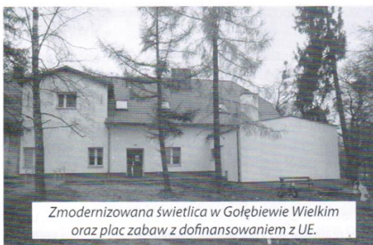
Zmodernizowana świetlica w Gołębiewie Wielkim oraz plac zabaw z dofinansowaniem z UE.