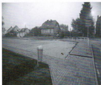
Parking i chodnik w Sobowidzu 339 tys.zł