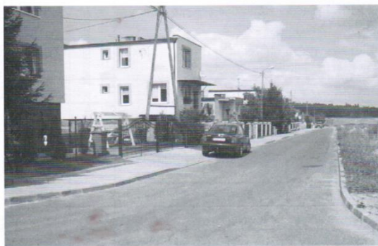
Budowa dróg wewnętrznych w Trąbkach Wielkich: Sportowa, Leśna, K.Pawłowskiej z dotacją z UE

Ps. Oto kilka zdjęć z naszych inwestycji