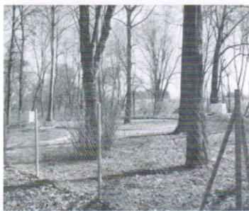
Wodociąg Kleszczewo, Gołębiewo Cegielnia, Błotnia, Elganowo koszt: ponad 1mln.zł.