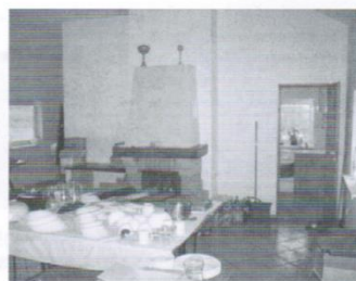
Świetlica w Trąbkach Małych - 147 tys.zł