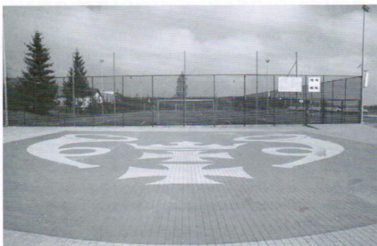
Boisko wielofunkcyjne „Orlik” z dotacją z UM i MS