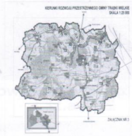
Plan zagospodarowania przestrzennego dla 20 miejscowości 790 ha. Koszt 150 tys zł.