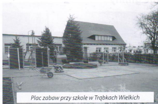
Plac zabaw przy szkole w Trąbkach Wielkich