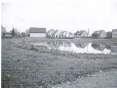
Zagospodarowanie centrum wsi Mierzeszyn - 45,5 tys.zł