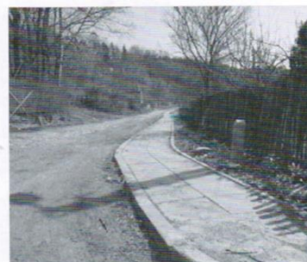
Chodnik Drzewina 6,9 tys.zł.