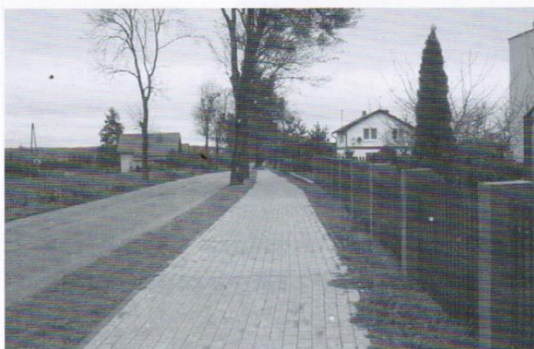
Chodnik Kaczki - Trąbki Wielkie z dotacji NPRDL