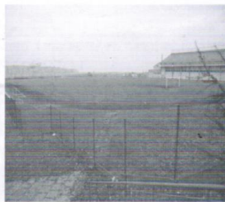
Boisko w Trąbkach Wielkich 100 tys.zł.