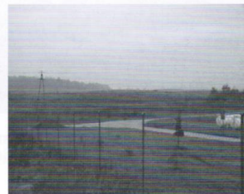
Zakup gruntu pod inwestycje w Trąbkach Wielkich - 282 tys.zł