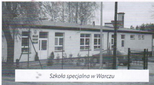
Szkola specjalna w Warczu