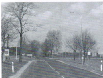
Oświetlenie dróg - 88 tys.zł.