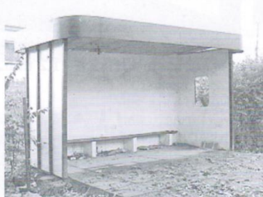
Budowa wiat przystankowych w Gołębiewku, Kleszczewie, Cząstkowie, Domachowie, Trąbki Małe, Rościszewko, Kaczki - 30 tys.zł