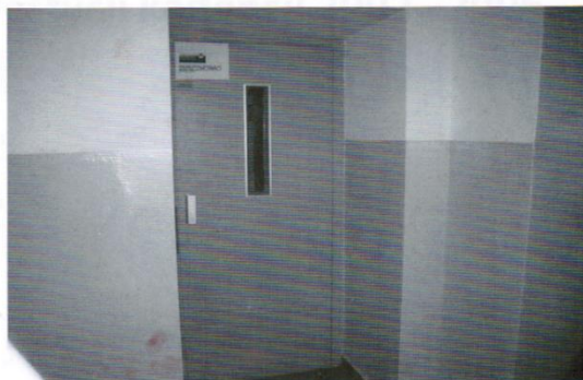
Winda w szkole w Sobowidzu z dotacją PEFRON-u