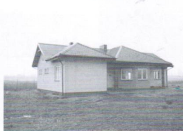
Świetlica w Elganowie - 260 tys.zł