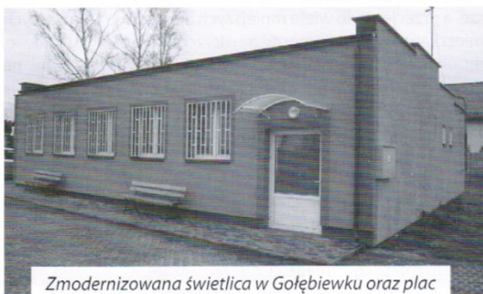
Zmodernizowana świetlica w Gołębiewku oraz plac zabaw z dofinansowaniem z UE