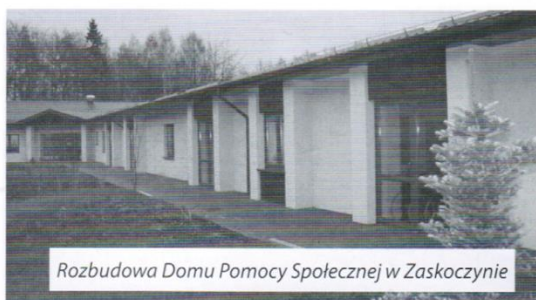
Rozbudowa Domu Pomocy Społecznej w Zaskoczynie