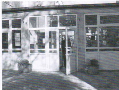
Szkoła Podstawowa w Sobowidzu: kompleksowy remont (pierwszy od prawie 30 lat) sali gimnastycznej, wejścia głównego do szkoły, wymiana stolarki okiennej i drzwiowej.