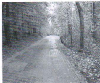
Droga Kaczkzi - Łaguszewo - 179 tys.zł