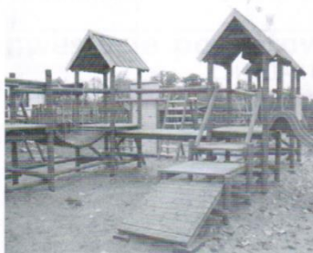
Plac zabaw Pawłowo 27 tys.zł