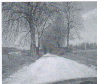
Droga Czerniec - Zaskoczyn 30 tys.zł.