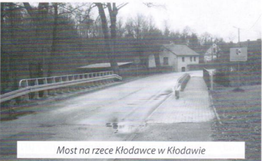
Most na rzece Kłodawce w Kłodawie