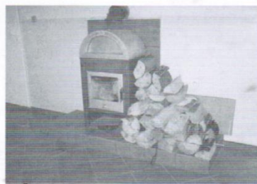
Świetlica Kleszczewo 49 tys.zł