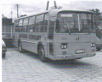
Zakup autobusu szkolnego - 364 tys.zł.