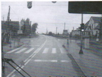
Skrzyżowanie w Gołębiewie Wielkim udział gminy 50 tys.zł.