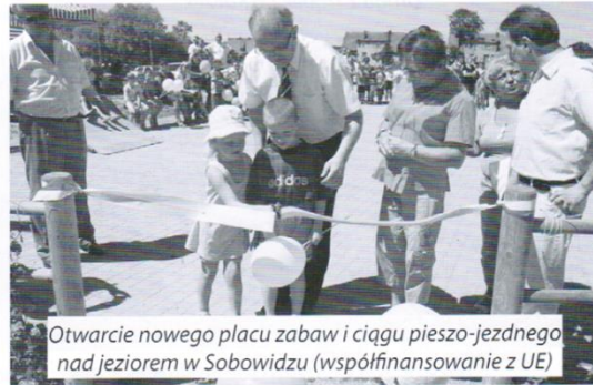
Otwarcie nowego placu zabaw i ciągu pieszo-jezdnego nad jeziorem w Sobowidzu (współfinansowanie z UE)