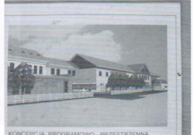
KONCEPCJA PROGRAMOWO - PRZESTRZENNA