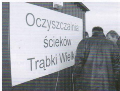
Budowa oczyszczalni ścieków w Trąbkach Wielkich - 1,2 mln.zł.