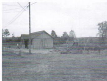
Włata festynowa w Złej Wsi 31 tys.zł