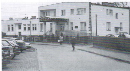
Modernizacja Ośrodka Zdrowia w Trąbkach Wielkich