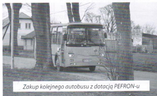
Zakup kolejnego autobusu z dotacją PEFRON-u