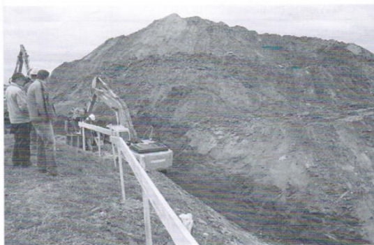
Budowa kanalizacji w aglomeracji Trąbki Wielkie