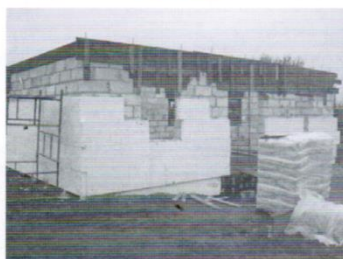
Budowa świetlicy w Gołębiewie Średnim -165 tys.zł