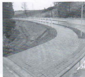
Chodnik w Kłodawie 165 tys.zł