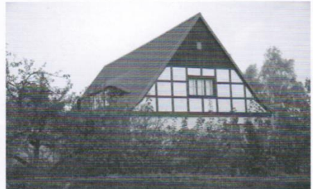
Szkoła Podstawowa w Trąbkach Wielkich; otrzymała nową elewację zewnętrzną szkoły, profesjonalną pracownię internetową oraz szereg mniejszych remontów i wyposażenia szkoły

Łączne wydatki na inwestycje (bez budowy gimnazjum w Trąbkach Wielkich) i remonty w budynkach szkolnych wyniosły 1,2 mln zł.