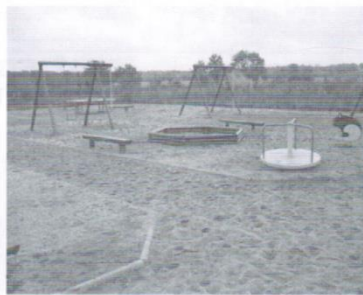
Plac zabaw Domachowo 31 tys.zł