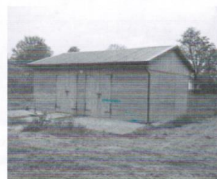
Włata festynowa w Cząstkowie - 28 tys.zł.