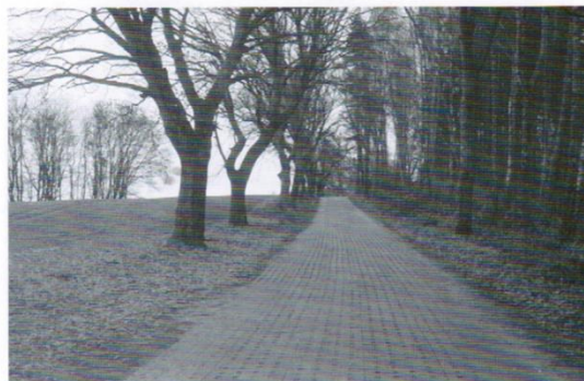
Droga z Kaczek do Łaguszewa z dotacją z UM