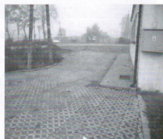
Zagospodarowanie terenu wokół parkingu w Gołębiewku - 11 tys.zł