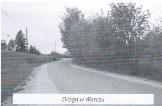
Droga w Warczu