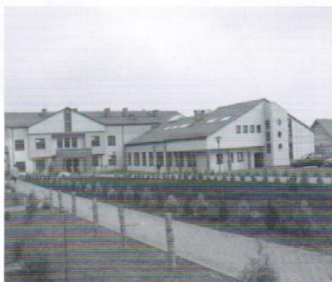
Budowa gimnazjum w Trąbkach Wielkich - 7,4 mln.zł.