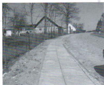
Chodnik Warcz-2,9 tys.zł.