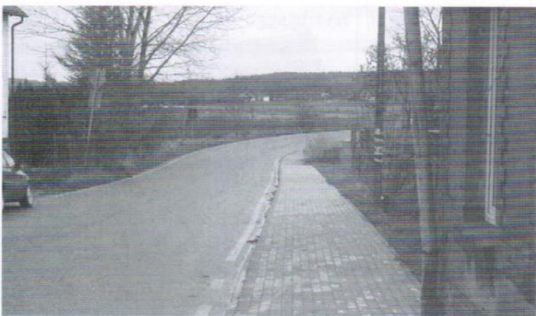
Droga z Trąbek do Kaczek